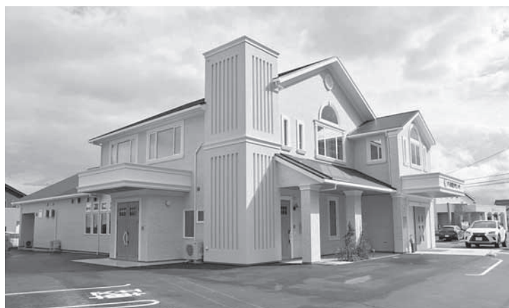
当社が手掛けたクリニックの外観

長年注文住宅を提供していた当社であったが、当社の環境や家計に優しい家づくりに共感した事業者からの声もあり、近年は注文住宅以外の建築も手掛けている。直近では、令和4年4月にはウイルスなどの微粒子を除去する全館空調「スーパークリーンマッハシステム」を備えたクリニックを