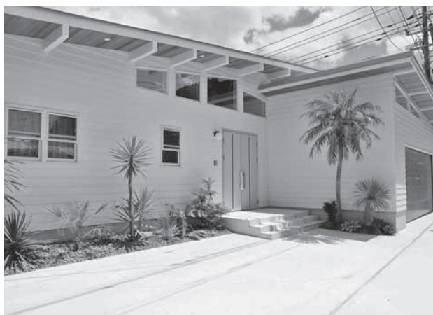
宮崎県産材を使用した宿泊施設外観

環境、家計に優しい家づくりを長年追求してきた当社。省エネ型住宅の第一線を走ってきた当社の引き合いはSDGsの浸透もあって更に強まることが予想されるが、家主、事業者、地球のために今日もまた新たな挑戦を続ける。地球のため、明るい未来のため。